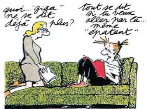
© Claire Bretécher / Dargaud, Agrippine, 1988

Bastien a un vocabulaire très choisi, très policé, soutenu. Sa mère ne supporte pas cette manière de parler « il parle comme un bourgeois, il ne parle pas comme nous ». Au cours de sa construction identitaire, cet adolescent cherche encore qui il est, son Idéal du Moi est pour l'instant tourné vers un désir d'ascension sociale forte, il cherche à l'affilier à un groupe en position sociale « haute », en opposition avec ce qu'il vit au quotidien et dont il souffre.